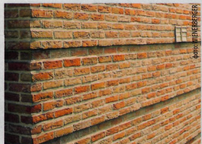
↑ Кирпич с неровными краями и шероховатой поверхностью