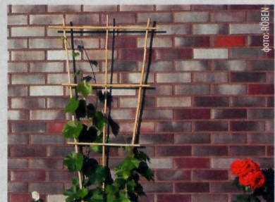
↑ Глазурованный кирпич