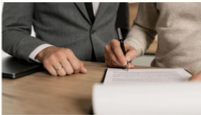
Спадок без паперів — як довести право на житло, якщо документи втрачені

В Україні мають намір переписати правила щодо нерухомості: у Раду внесли новий законопроект