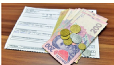
Житлова субсидія - як оформити недоотриману субсидію - Економіка 24

Компенсація за розміщення ВПО: нові правила виплат. Що потрібно знати?