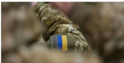
Відпустки для військовослужбовців 2025: які є види та умови надання в Україні

Військові та їхні сім'ї можуть безкоштовно відпочити в санаторії: як отримати путівку