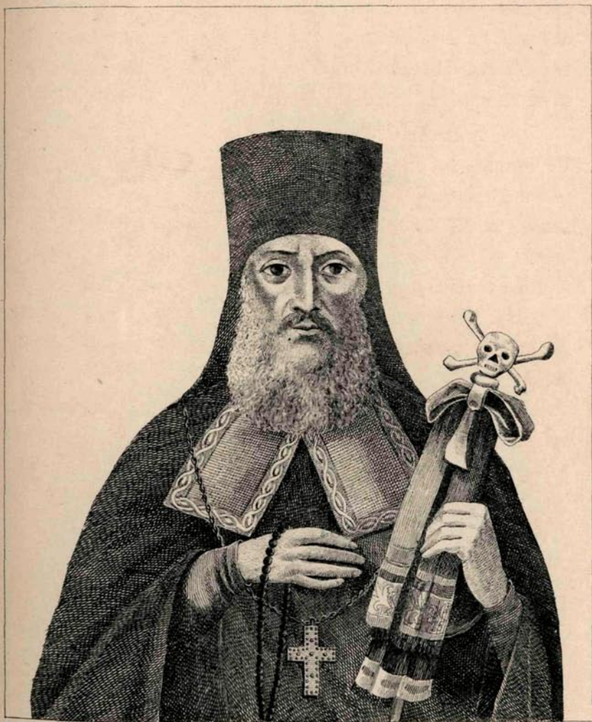
ХРОМО-ЛИТОГРАФИЯ Е.И.ФЕСЕНКО ВЪ ОДЕССѢ

МОЛЧАВНОЙ СОФРОНИЕВОЙ ПУСТЫНИ АРХИМАНДРИТЪ СТАРЕЦЪ АВРОДИЙ ЛАСЛОВЪ ПРЕСТАВИСЯ ВЪ ЯНУАРИИ ГОДУ, МѢСЯЦА ДЕ- КАБРА 2. ГО ДНЯ, И ПОГРЕБЕНЪ ВЪ ОНОЙ-ЖЕ ПУСТЫНИ ВЪ СОВОРНОЙ ЦРКВѢ РАЖСТВО ПРѢТЪМЪ БЦЫ, НА ПРАВОЙ СТОРОНѢ ЗА СТОЛПОМЪ.