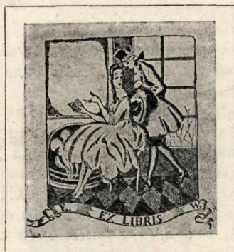
Экслибрис эпохи господства буржуазии

В период дворянско-помещичьего господства появлялись