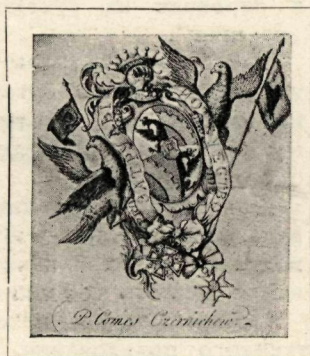
Экслибрис эпохи дворянского господства

В России экслибрис появляется значительно позже, только при Петре Великом, будучи со всеми новшествами преобразователя завезен к нам из Европы одним из просвещеннейших его сподвижников князем Д. М. Голицыным, который обладал огромнейшей по тому времени библиотекой.